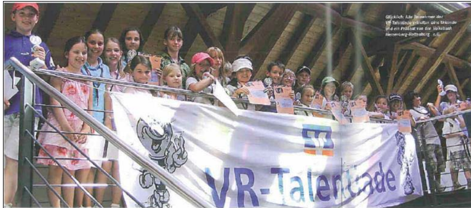
Glücklich Alle Teilnehmer der VR-Talentiade gratuliert zum Abschluss und ein Preis von der Volksbank Herrenberg-Rottenburg e.G.