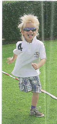
Reguliert: Die Kinder hatten viel Spaß bei der 1. VR-Talentiade

weis stellen. Zahlreiche Helfer hatten dazu Teile der Driving Range, des Putting Grüns und des Übungsplatzes aufwendig für diesen Wettbewerb präpariert und begleiteten die begeisterten Teilnehmer durch die diversen Disziplinen.